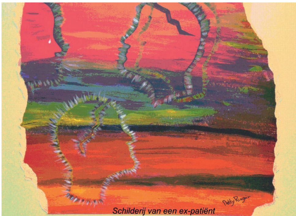
Schilderij van een ex-patiënt

We hopen veel lotgenoten te ontmoeten op 23 november. U kunt gewoon binnenlopen. Afspraak maken is niet nodig.