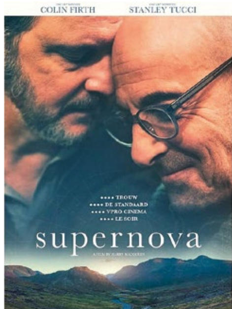
Wereld Alzheimerdag met de film Supernova Donderdag 21 september 20.00 uur Tickets: 5 euro (Een gedeelte van de ticketopbrengst doneren wij aan Alzheimer Nederland).

bestellen. U dient dan wel lid te zijn (of lid te worden) van de Belbus. U betaalt voor de busrit op deze avond in de bus. De ticket voor de voorstelling koopt u via Theater de Tuyter.