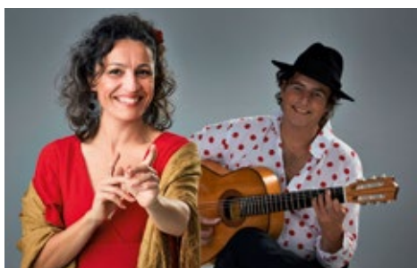
Muziekcafé Monica Coronado & Manito Zondag 5 november 15.00 uur Tickets: 7,50