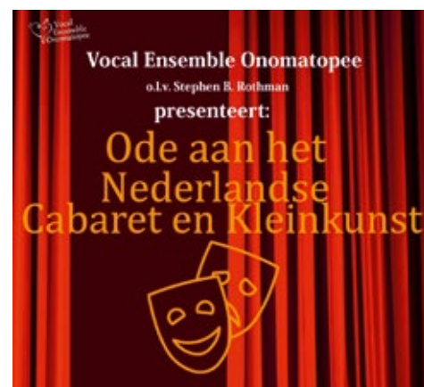
Vocal Ensemble Onomatopoeie Ode aan het Nederlandse Cabaret en Kleinkunst Zaterdag 16 december 20.00 uur Tickets: 7,50 (inclusief 1 consumptie)