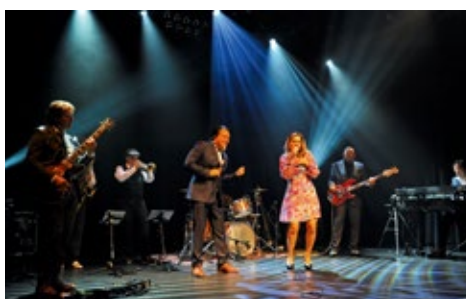
Theaterconcert A tribute to soul of the '60's Zaterdag 21 oktober 20.30 uur Tickets: 17.50