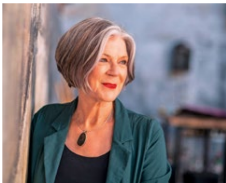
Theaterconcert Lenny Kuhr Zaterdag 30 september 20.00 uur Tickets: 15 euro

Meer informatie over de programmering van Theater de Tuyter is terug te vinden op www.uitagendakrimpen.nl . Het fysieke programmaboekje is gratis op te halen in de Tuyter. Tickets zijn verkrijgbaar via www.uitagendakrimpen.nl of in de Tuyter bij het bespreekbureau op werkdagen tussen 9.30-11.30 uur.